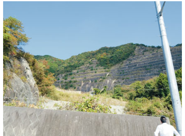
残土が盛り土される予定の採石場