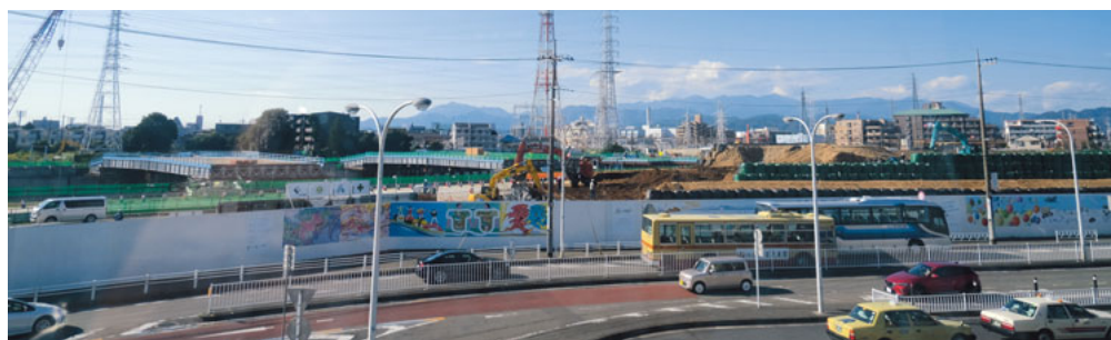
橋本駅前の相原高校跡地。駅建設のため地下深くまで掘削されている

現知事は、利便性を重視し、高校生の学業よりも『経済』を優先させたものです。しかし、本当に経済的にも効果があるのか、かなり怪しくなっています。